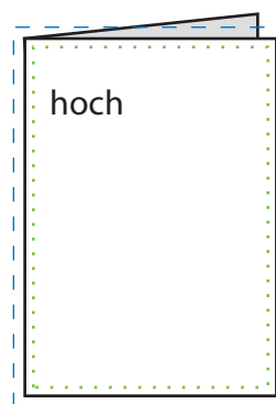
offen 21 x 29,7 cm